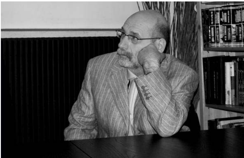
Писатель Борис Акунин на презентации книги "Михаил Ходорковский. Статьи. Диалоги. Интервью". Париж, книжный магазин "Глоб".