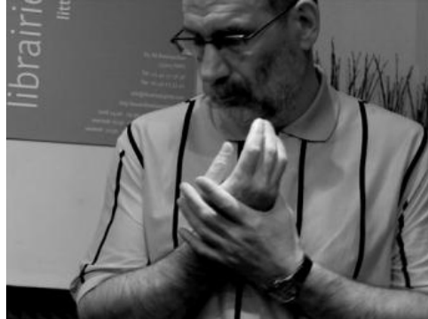
Писатель Борис Акунин на презентации книги "Михаил Ходорковский. Статьи. Диалоги. Интервью". Париж, книжный магазин "Глоб".

состоялась встреча с писателем Борисом Акуниным, посвященная презентации книги Михаила Ходорковского. Книга «Статьи. Диалоги. Интервью» была опубликована в Москве в декабре в издательстве «Эксмо», ее французская версия выйдет в сентябре в издательстве «Фаяр».